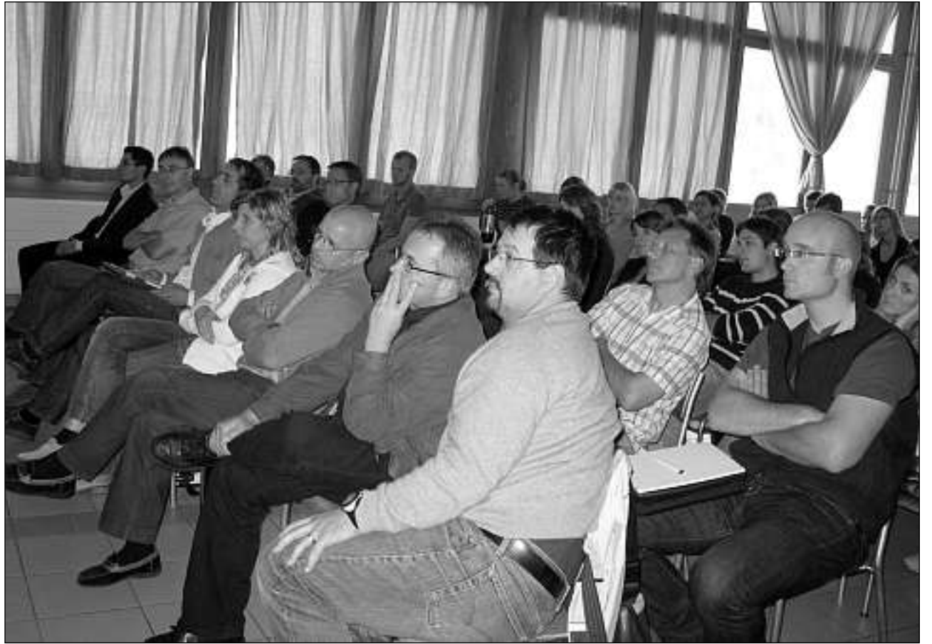
Cun atenziun han representants dallas vischnauncas dalla Cadi e dalla Region Surselva persequitau ils projects presentai dils students da turissem.

La finamira primara ei d'animar dapli passants da far in paus sigl Alpsu e da discuvierer da leu anora la tgina dil Rein. Per render attentis il hosp a quella attraziun unica stoppien els vegnir informai e guidai cun signals da traffic, tablas d'informaziun e guidai a moda directa sillas sendas existents. Las tablas d'informaziun ston esser capeivlas per in e scadin e vegnir actualisadas permanentamein. Sigl ault dil pass duei vegnir installau en in liug central in center d'informaziun. Igl access alla tgina dil Rein ei garantida entras duas sendas. Fertion che la senda cuorta duei vegnir concepida sco senda tematica per famiglias cun affons cun informaziuns davart flora e fauna, duei l'otra esser destinada per viandonts rutinai e sportists. Ella vischinonza dil lag duei vegnir installau in plaz da pausadi cun fueinas e grils.