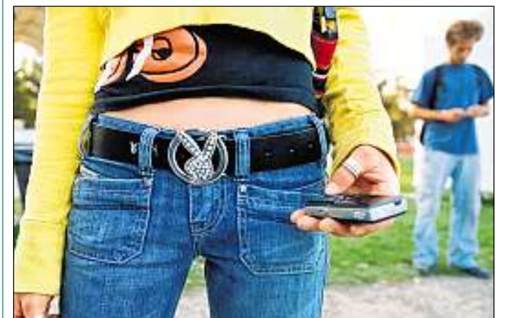
Blers juvenils fan diever dal numer 147 da la Pro Juventute.