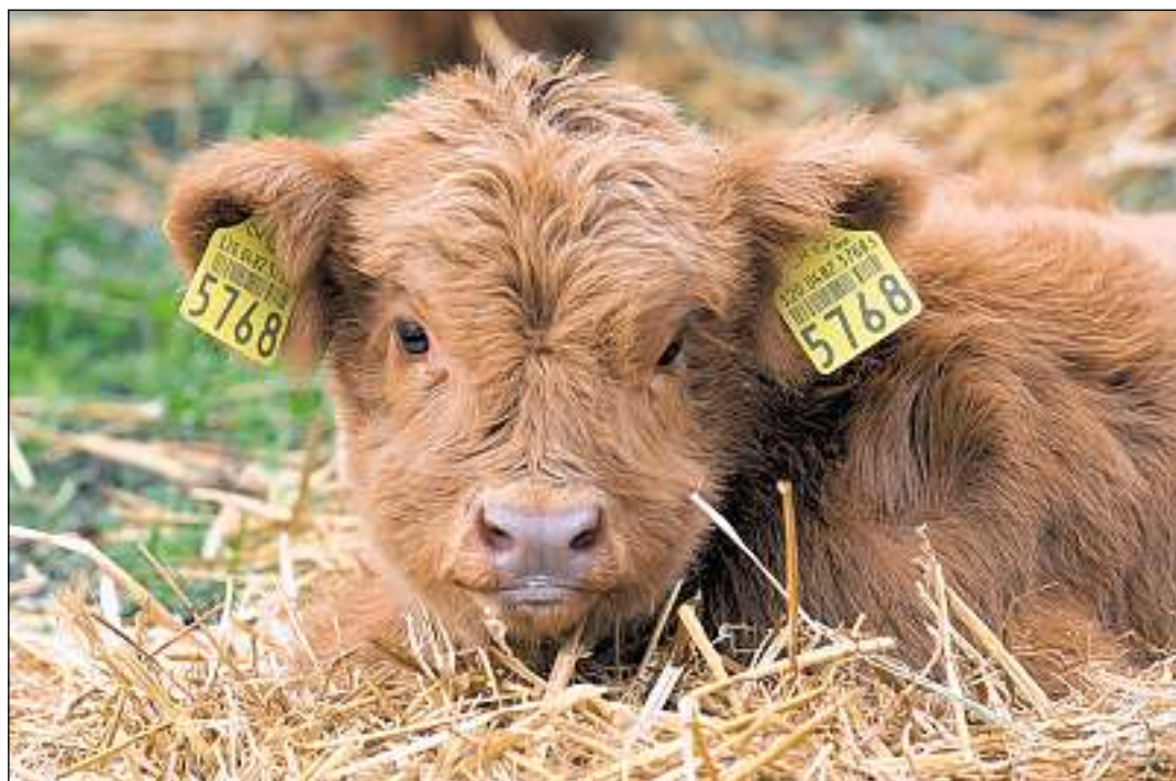
Tenor la regenza èn las indemnisaziuns ecologicas per part memia bassas ed ils pajaments directes na sajan betg colliads vi da prestaziuns supplementaras en las disposiziuns novas tar la politica agrara 2011.

(lq) En in culm a St. Antönien en Purtenza è in chatschadur sa disgrazià ier la damaun mortalmain. A la tschertga da selvaschinas è l'um da 30 onns sa glischnà sin pastg bletsch e cupitgà en ina plauunca verticala 25 meters en in vallun.